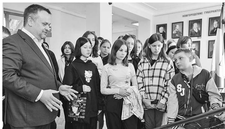
Школьники из Запорожья с интересом слушали губернатора

– Для нас большая честь, что Новгородская область выбрана центром празднования 280-летия Гавриила Романовича Державина. Спасибо федеральным коллегам за поддержку, развитие юридического компонента нашей работы. Не так много людей, которых через 280 лет вспоминают с такой теплотой.